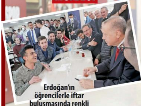
Erdoğan'ın öğrencilerle iftar buluşmasında renkli anlar yaşandı.

Başkan Erdoğan, Maltepe'de yurttan kalan öğrencilerle iftar yaptı. Erdoğan, mayıs ayı kredi ve burs ödemelerinin bayramdan önce hesaplara yatacağını müjdeledi, öğrencilerle masa tenisi oynadı.