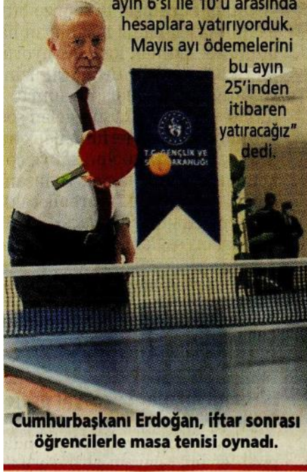
Cumhurbaşkanı Erdoğan, iftar sonrası öğrencilerle masa tenisi oynadı.

Cumhurbaşkanı Tayyip Erdoğan, İstanbul Maltepe'de Mimar Sinan Erkek Öğrenci Yurdu 'nda öğrencilerle iftar yaptı. Kredi ve burs ödemelerinin erken yapılacağını belirten Erdoğan, "Bu yıl kredi veya burs alan 1 milyon 374 bin öğrencimiz var. Ödemeleri ayın 6'sı ile 10'u arasında hesaplara yatırıyoruz. Mayıs ayı ödemelerini bu ayın 25'inden itibaren yatıracağız" dedi.