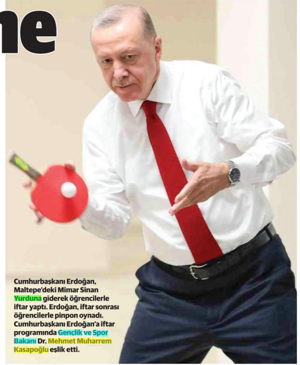
Cumhurbaşkanı Erdoğan, Maltepe'deki Mimar Sinan Yurduna giderek öğrencilerle iftar yaptı. Erdoğan, iftar sonrası öğrencilerle pinpon oynadı. Cumhurbaşkanı Erdoğan'a iftar programında Gençlik ve Spor Bakanı Dr. Mehmet Muharrem Kasapoğlu eşlik etti.

de, Cumhurbaşkanı Erdoğan'ın Rusya ile Ukrayna arasındaki arabuluculuk konusunda özel rolü olduğunu söyledi. Rutte "Bunu yapan birkaç Batı dışı ittifaklarımızdan biridir. Diğerleri İsrail'den Naftali Bennett ve Hindistan'dan Narendra Modi. Türkiye'yi özel kılan, Rus saldırınlığının başkalarının aksine gerçekleşen kınanmış olmasıdır" dedi.