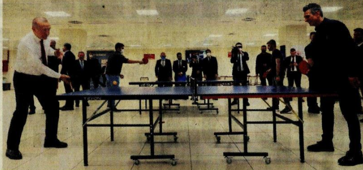
Cumhurbaşkanı Erdoğan, öğrencilerle iftarın ardından Kadın Voleybol Milli Takım Antrenörü Giovanni Guidetti ile masa tenisi oynadı.

Erdoğan, Ukrayna-Rusya müzakerelerine ilişkin sunları söyledi: "Sonuç olumlu. Fakat istediğimiz gibi değil. Ama daha iyi olacak. Ümitsiz değiliz. Sayın Putin, Sayın Zelenski ile de bugün yarın bir görüşme yapmayı planladık. Bu görüşmeyle birlikte inşallah İstanbul'umuzdaki süreci liderler seviyesinde devam ettirmeyi planlıyoruz. Temenni ederim ki bu davetimize icabet ederlerse üst düzeydeki buluşmayı da inşallah İstanbul'umuzda gerçekleştiririz."